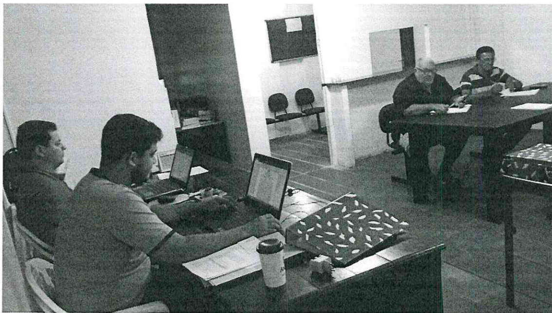
Pedreiras (MA), em 25/02/2019.