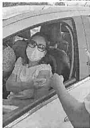
Primeira servidora da Seap a ser vacinada

Para concretizar a vacinação é importante levar todos os documentos necessários. Os servidores efetivos e comissionados devem apresentar documento com foto, CPF e contracheque atualizado. Para os servidores terceirizados, além destes documentos devem levar ainda declaração emitida pelo setor de Supervisão de Gestão de Pessoas (SGP) da Seap. A vacinação conta com a participação direta de 62 servidores da área da saúde da Seap, que estão atuando diretamente na campanha entre enfermeiros, técnicos de enfermagem e técnicos administrativos.