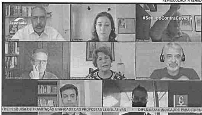
Especialistas do setor elétrico e senadores participaram, nessa segunda-feira, de audiência pública remota da Comissão de Direitos Humanos

Em audiência pública remota realizada nessa segunda-feira (31), na Comissão de Direitos Humanos (CDH) do Senado, especialistas e parlamentares criticaram pontos polêmicos da Medida Provisória (MP) 1.031/2021, que trata da privatização da Eletrobras. Eles alegaram que a venda das ações da estatal vai resultar em aumento considerável da tarifa de luz, abertura de mais espaço para as térmicas (carbonização) em detrimento das fontes renováveis (água, sol e vento) e perda da soberania no setor elétrico. O presidente da CDH, senador Humberto Costa (PT-PE) alertou, por exemplo para um possível racionamento por conta da crise hídrica e das problemáticas da crise econômico-sanitária resultante da Covid-19 e foi um dos que se manifestou contrário à discussão de uma privatização neste momento.