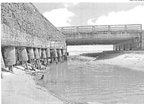
Grande quantidade de esgoto em natura foi descartada na foz do Rio Pimenta no último sábado

Um morador e comerciante que mora ao lado do Rio Pimenta, não quis se identificar, mas fez uma de-