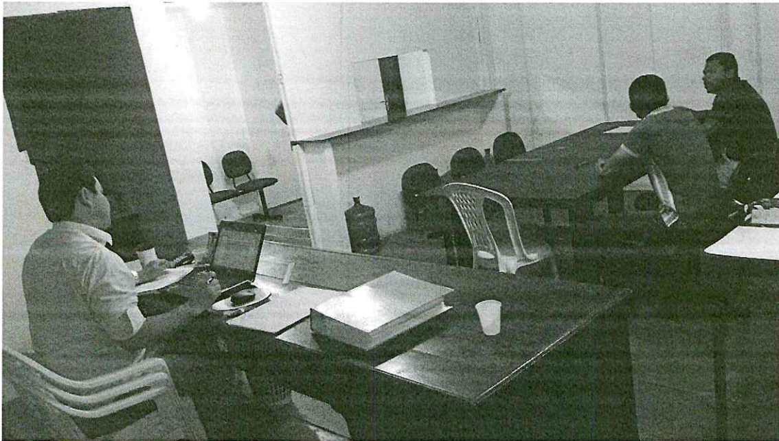
Pedreiras (MA), em 27/03/2019.