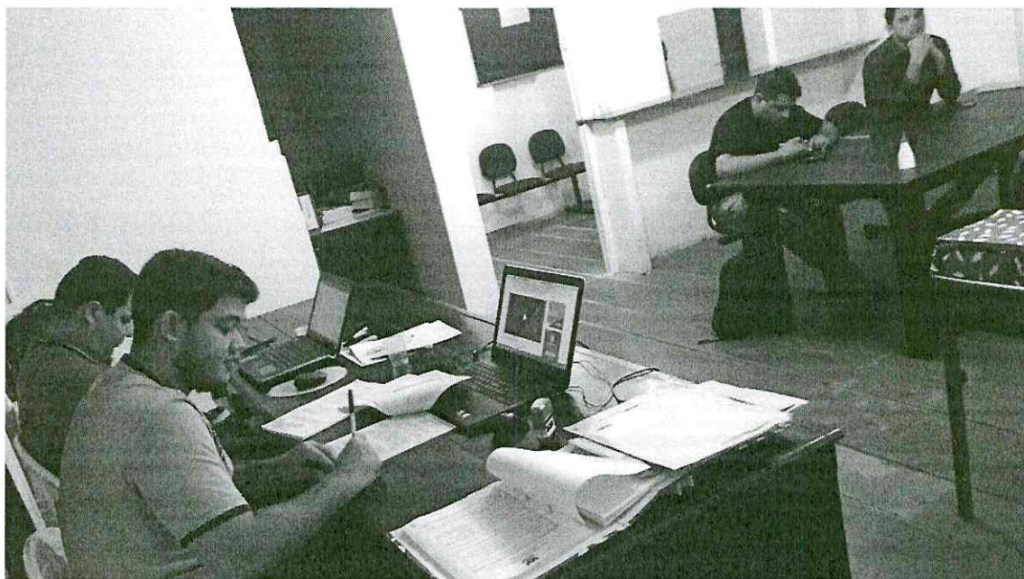
Pedreiras (MA), em 25/02/2019.