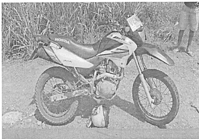
Mofo envolvida no acidente

Na tarde desta terça-feira (23), foi registrado um acidente com vítima fatal na BR 010, no município de Governador Edson Lobão. O acidente envolveu uma motocicleta e um caminhão. O condutor da motocicleta veio a óbito no local. A passageira, esposa do motorista, foi levada pelo SAMU em estado grave. A dinâmica do acidente encontra-se em análise pela equipe que realizou o