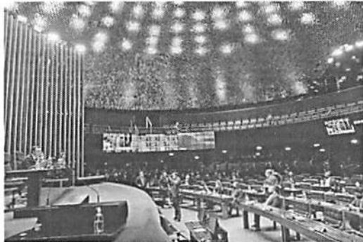
Projeto já foi aprovado pelo Senado em julho, mas os deputados alteraram o texto, e a decisão final por parte dos senadores poderá sair nesta quarta-feira