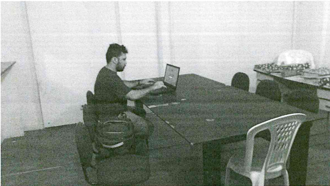
Pedreiras (MA), em 08/03/2019.