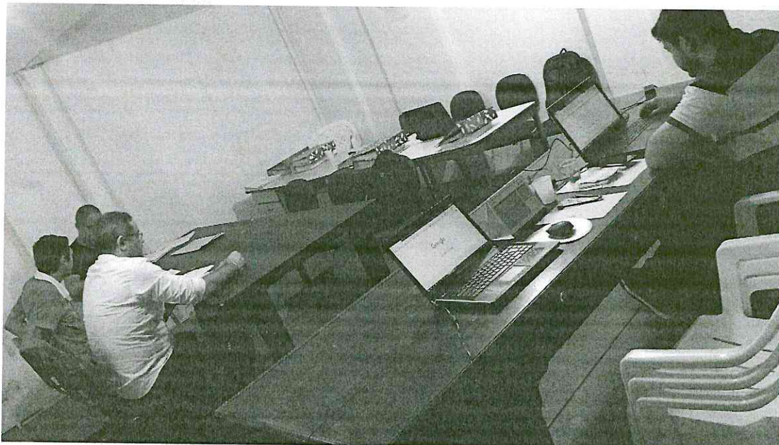
Pedreiras (MA), em 14/05/2019.