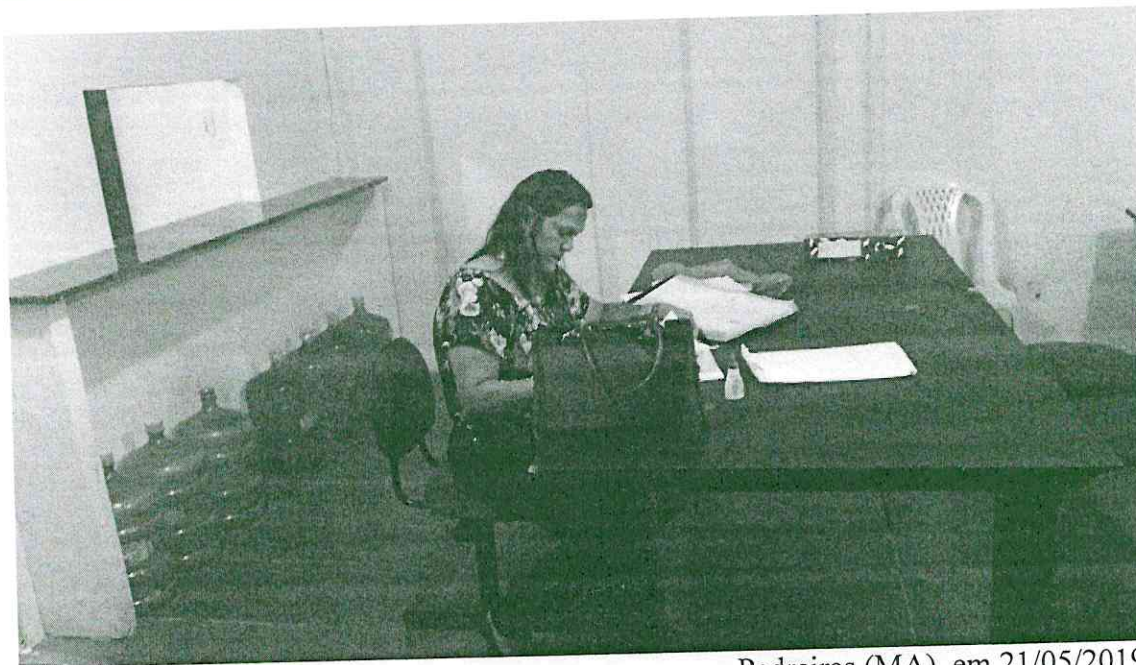
Pedreiras (MA), em 21/05/2019.