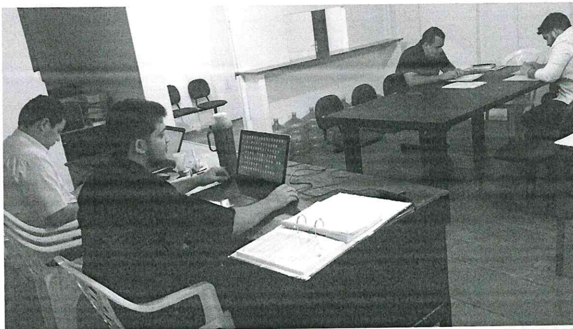
Pedreiras (MA), em 29/05/2019.

ESTADO DO MARANHÃO PREFEITURA MUNICIPAL DE PEDREIRAS - MA CNPJ: 06.184.253/0001-49 Rua São Benedito, s/n, Bairro São Francisco, CEP: 65.725-000