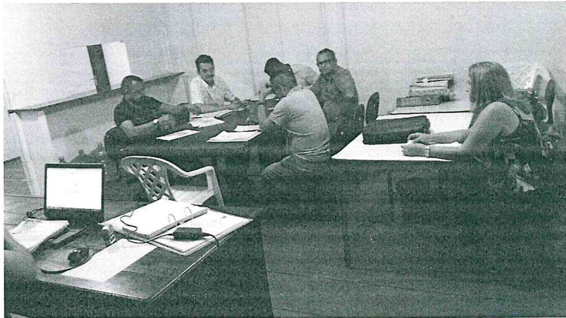
Pedreiras (MA), em 02/07/2019.