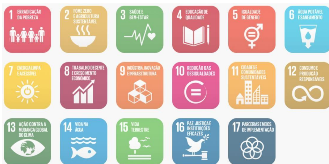
Figura 02: Objetivos de Desenvolvimento Sustentável