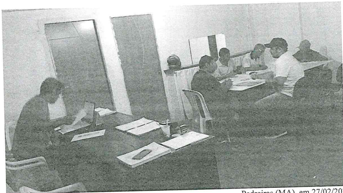
Pedreiras (MA), em 27/02/2020.